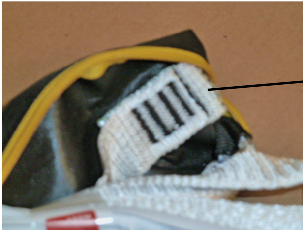
korrektes Nahtbild sternale Öse Absorbica (L59) mit vier! Sicherheitsnähten